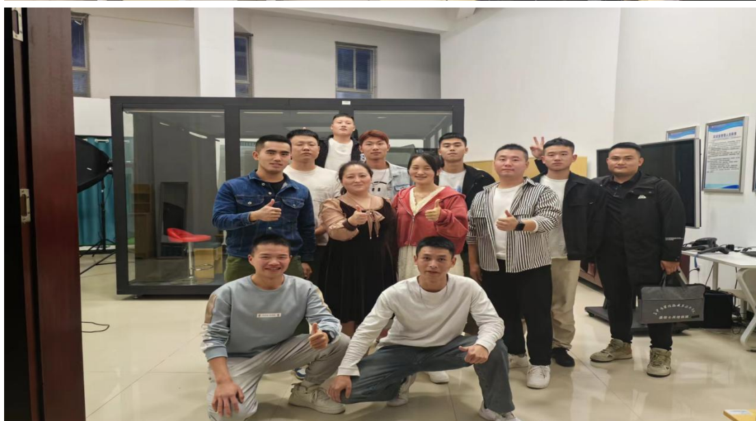
图示：长沙商贸职业技术学院旅游学院2023级退役士兵电商培训班课堂合影