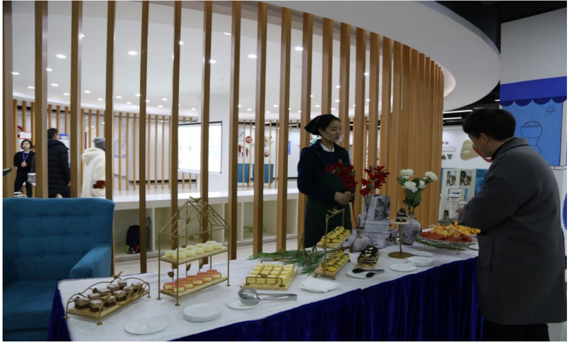
图注：咖啡书吧项目团队学生展示项目成果