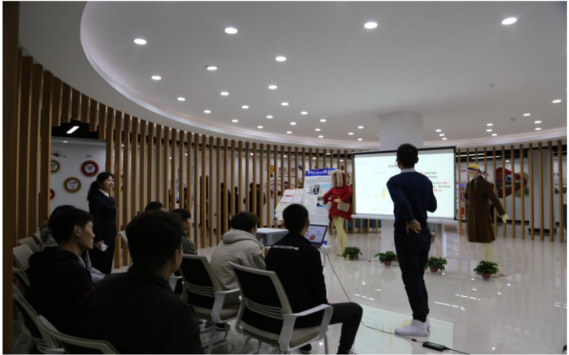
图注：创业团队学生展示创业项目