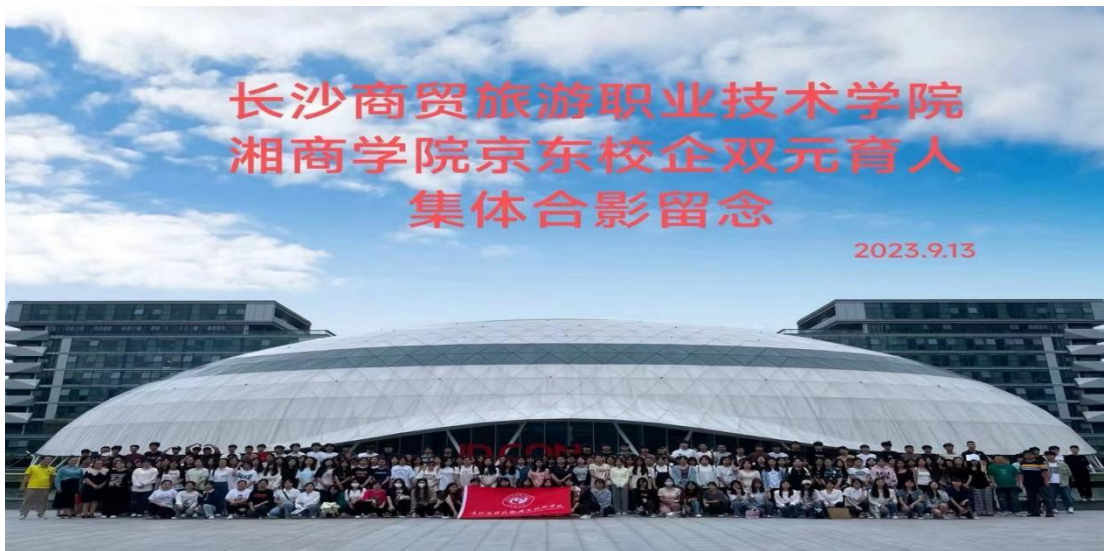
图示：长沙商贸职业技术学院旅游学院实习学生在京东（宿迁）全国客服中心总部实习合影