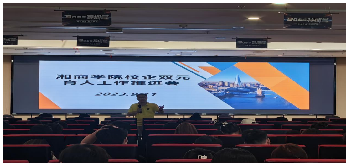
图示：长沙商贸职业技术学院旅游学院在京东（宿迁）召开双元育人工作推进会

2023年，长沙商贸旅游职业技术学院共有253名学生在京东（宿迁）全国客服中心总部开展了为期3个月的校企双元育人。在双元育人全阶段，实行“双导师制”管理模式，学校派遣指导老师、分管辅导员对实习全过程进行监管。学校领导和老师定期探望实习学生，关心其工作、生活中遇到的困难，努力协调解决。学生通过工学结合，增强了责任意识、职业意识，锻炼了沟通交流能力、团队协作能力、独立应变能力。