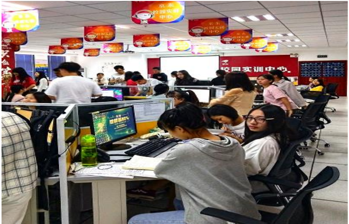
图示：京东实习学生客服实操