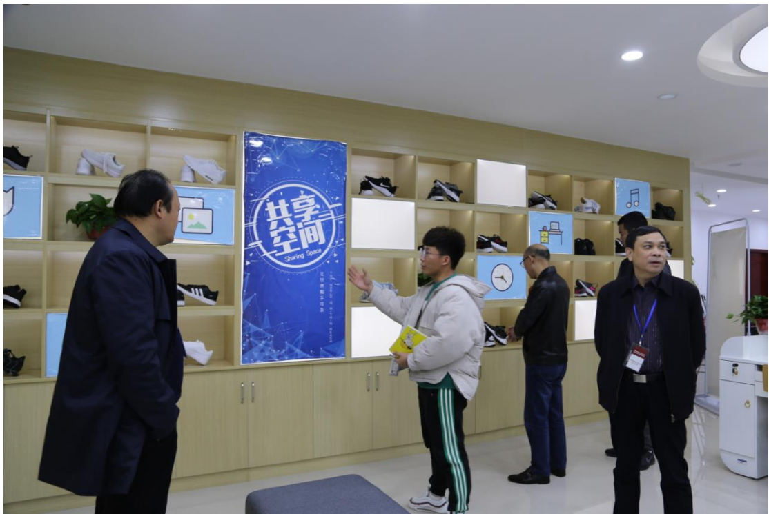
图注：共享空间项目团队学生介绍项目情况