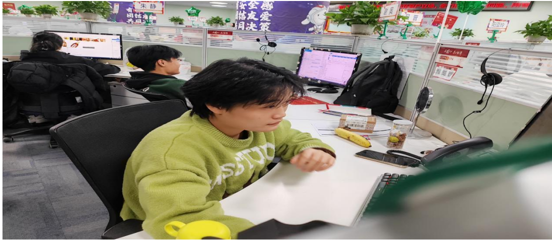
图示：长沙商贸职业技术学院旅游学院实习学生在京东（宿迁）全国客服中心认真工作